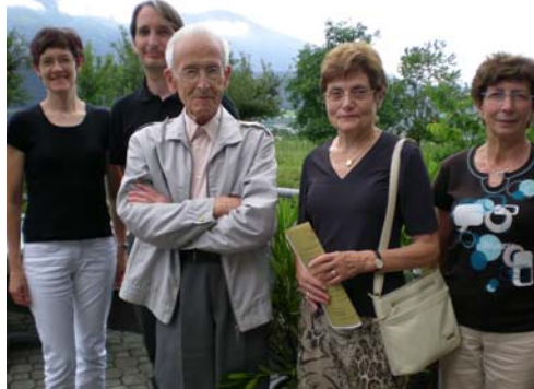
Von links nach rechts: