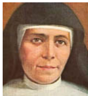
Heilige Maria Dominika Mazzarello